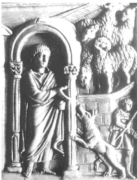
Elfenbeinrelief, ital., um 360

Vor lauter Hirtenromantik verlieren wir den Blick für den Wolf. Wir sollten uns fragen, wo der Wolf umherschleicht und wie gefährlich er für uns werden kann. Es würde den Worten vom Guten Hirten die Romantik nehmen und klarmachen, was Jesus wirklich meint: Der Einsatz gegen das Zerstörerische in unserer Welt kann das Leben kosten.